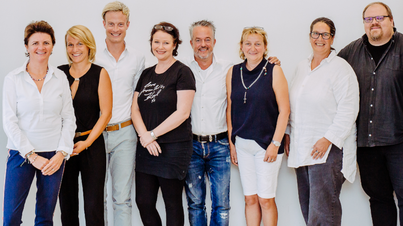
Die Jury von "tierisch engagiert" 2018