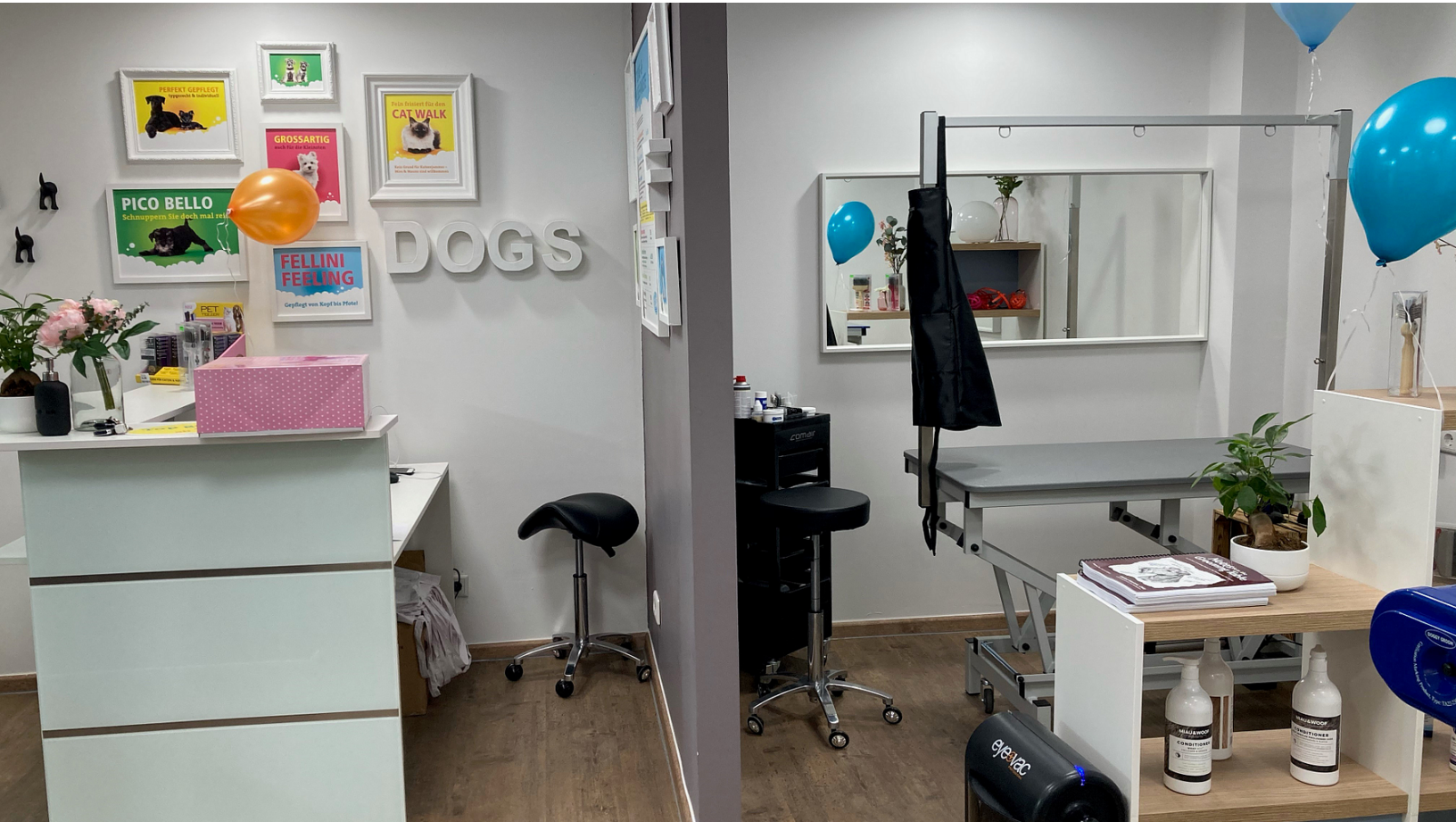
Der Fellini-Salon in Hagen ist bereit für tierische Kundschaft.