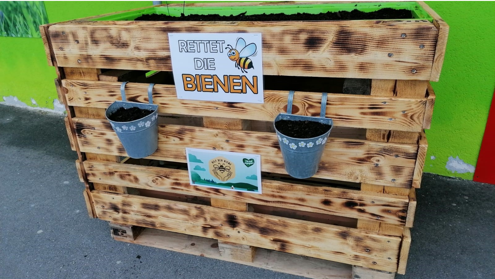
Das selbstgebaute Hochbeet für Insekten vor dem Fressnapf-Markt in Neustadt b. Coburg