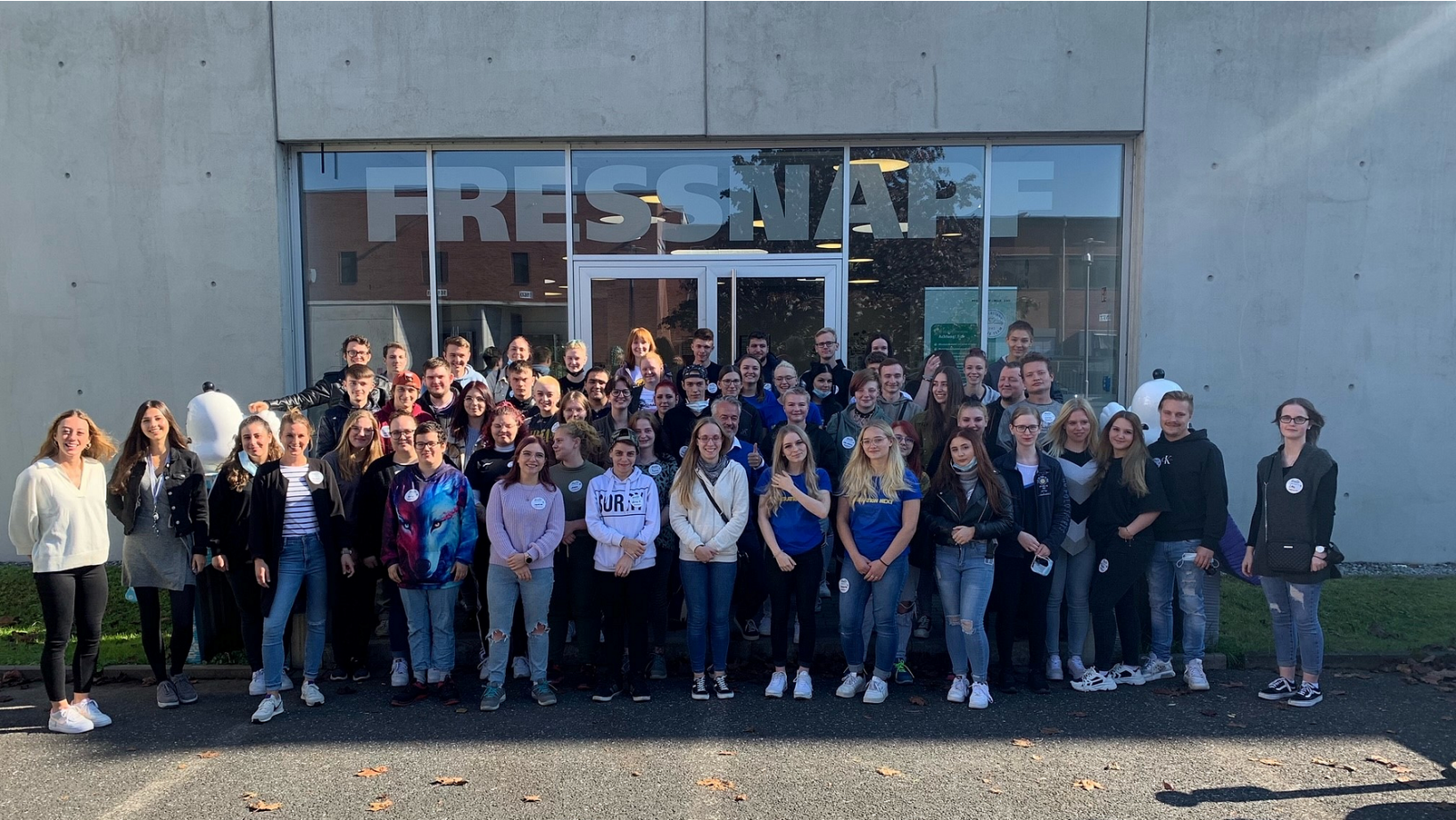
Frisch getestet und gut gelaunt: Fressnapf-Azubis freuen sich auf ihre neuen Aufgaben im Unternehmen.