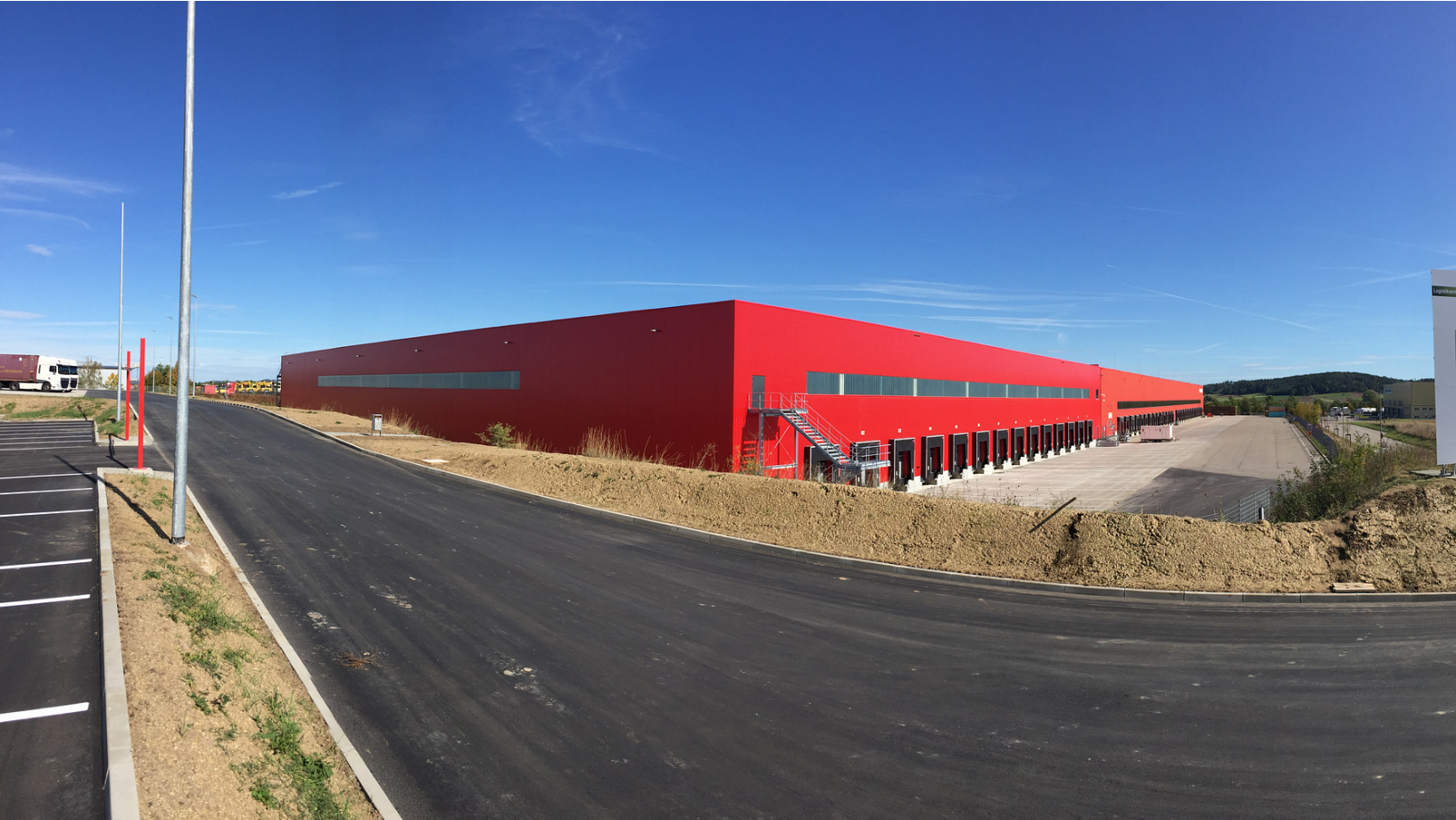
Der Fressnapf-Logistikstandort Feuchtwangen