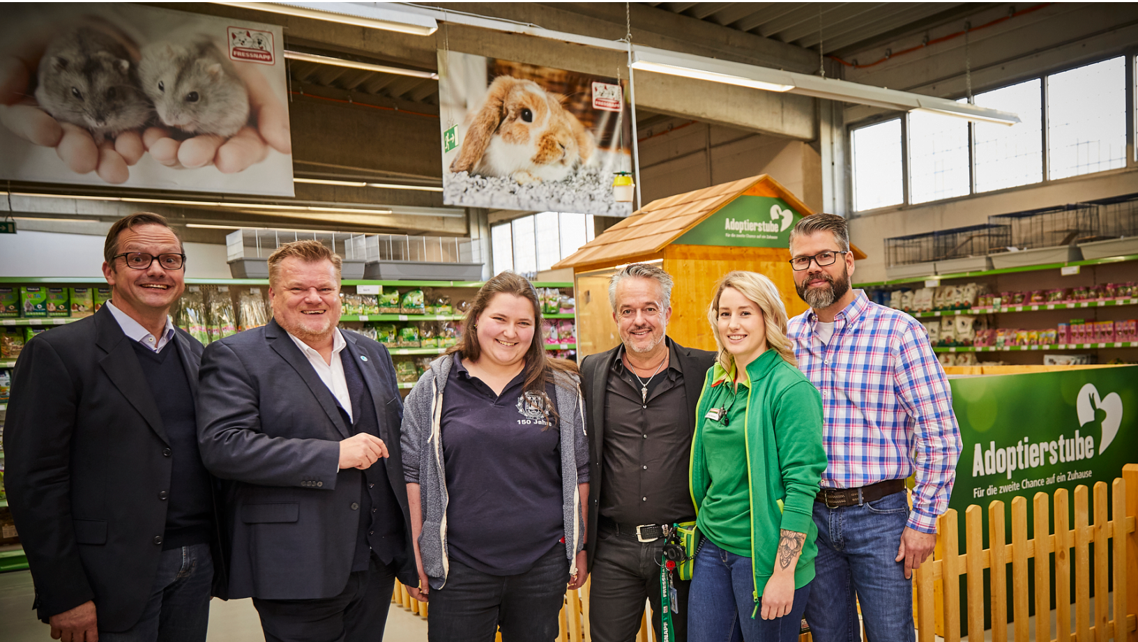
Eröffnung der Adoptierstube in Köln-Porz