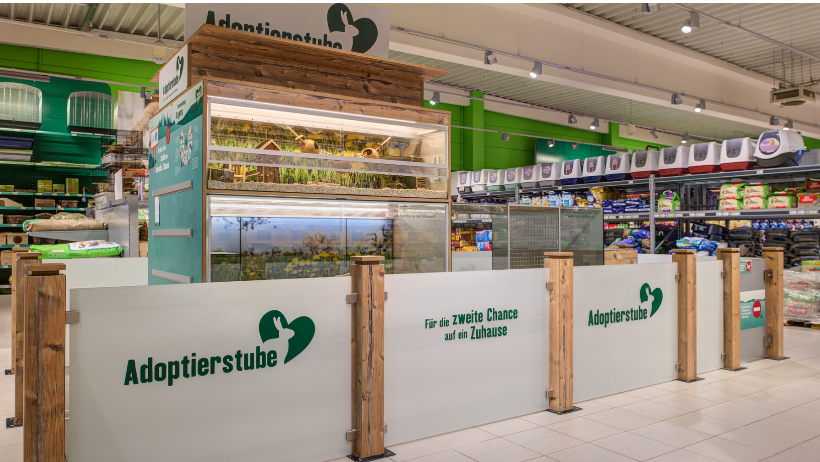
Die Adoptierstube im Fressnapf-Markt Hockenheim.